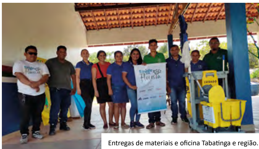
Entregas de materiais e oficina Tabatinga e região.