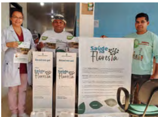
Entregas de Kits prevenção, totem, posto de saúde.