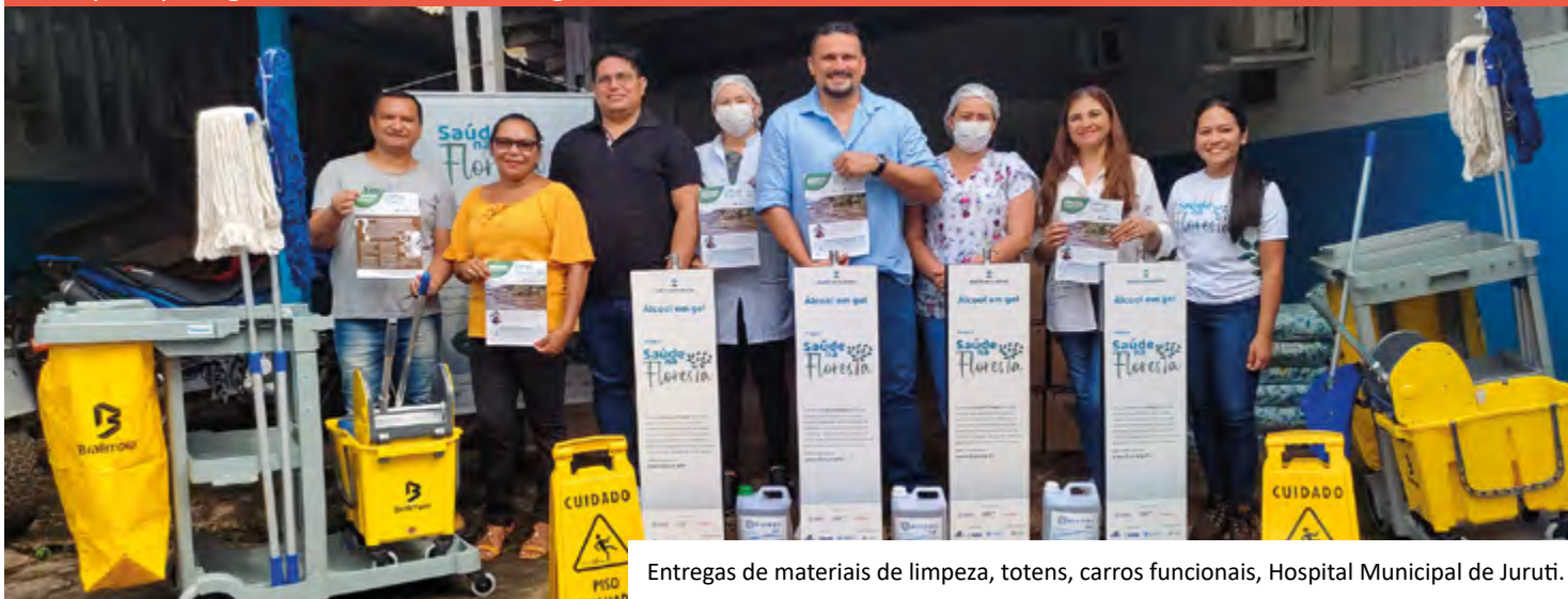
Entregas de materiais de limpeza, totens, carros funcionais, Hospital Municipal de Juruti.

Unidades básicas de saúde, a Universidade Federal do Oeste do Pará (UFOPA), Universidade Aberta do Brasil (UAB), polo Juruti, e a Sala Lilás, destinada a atender pessoas em situação de vulnerabilidade social e vítimas de violência e abuso, incluindo crianças, adolescentes, mulheres e idosos, também receberam kits de prevenção, totens e materiais de limpeza para garantir um ambiente seguro e saudável.