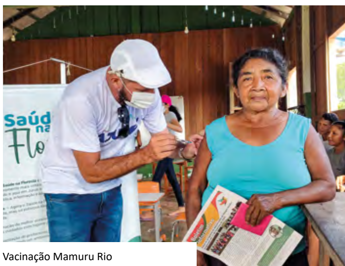
Vacinação Mamuru Rio