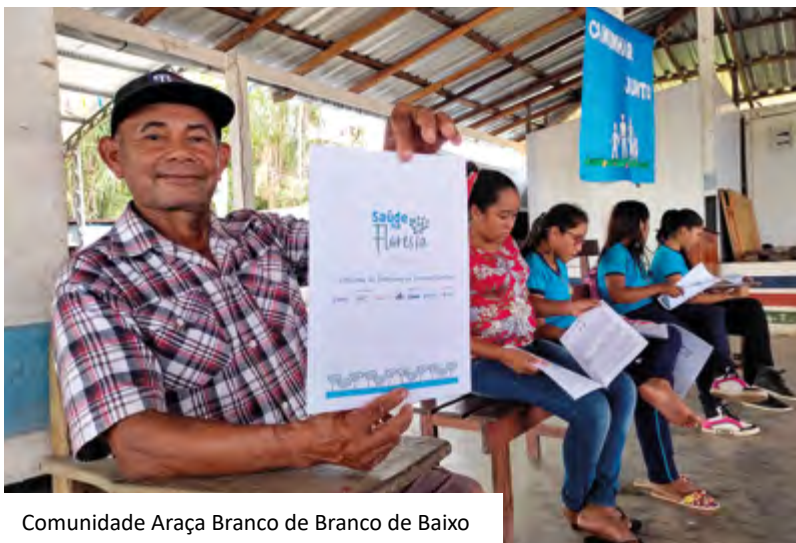
Comunidade Araça Branco de Branco de Baixo