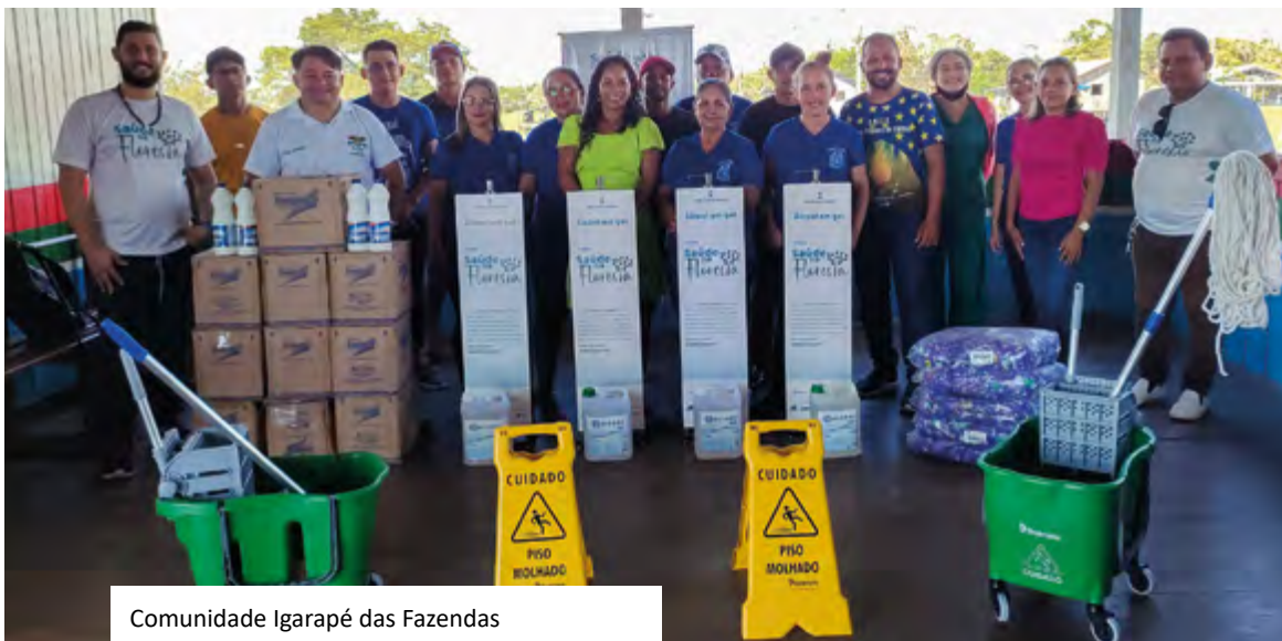
Comunidade Igarapé das Fazendas

Especificamente nas escolas, o projeto Saúde Floresta teve um impacto crucial na interrupção da cadeia de contágio da COVID-19. Em alguns casos, as escolas dependiam de doações dos funcionários e alunos para manter a higiene. Durante esse período, o projeto contribuiu para criar um ambiente limpo, priorizando a saúde de professores funcionários e alunos.