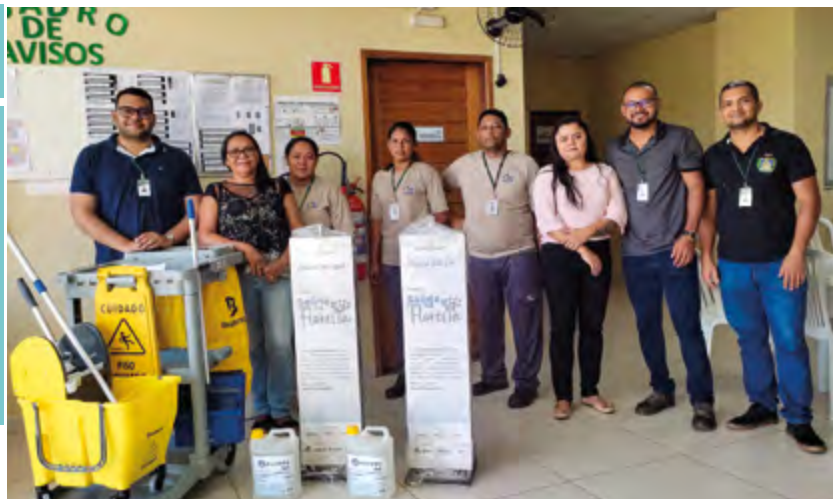
Entregas de materiais de limpeza, carro funcional e oficina UFOPA.