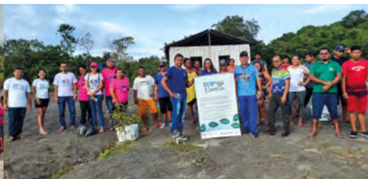
Vacinação E capacitações, Mamuru Rio