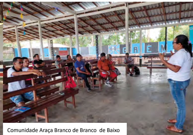
Comunidade Araça Branco de Branco de Baixo