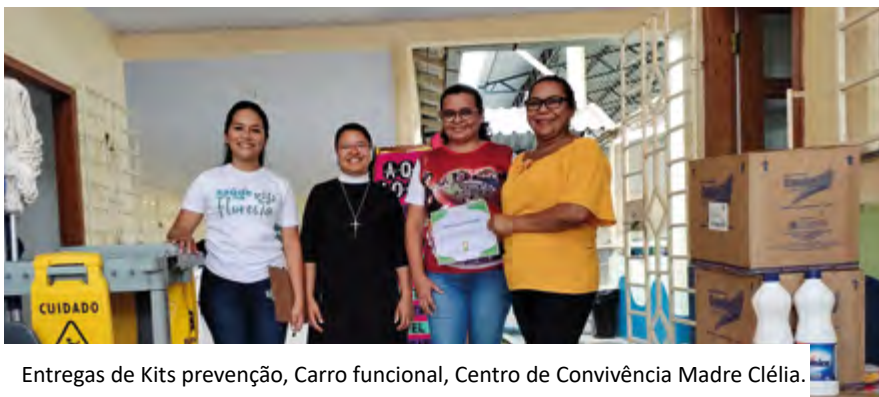
Entregas de Kits prevenção, Carro funcional, Centro de Convivência Madre Clélia.