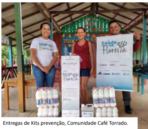
Entregas de Kits prevenção, Comunidade Café Torrado.