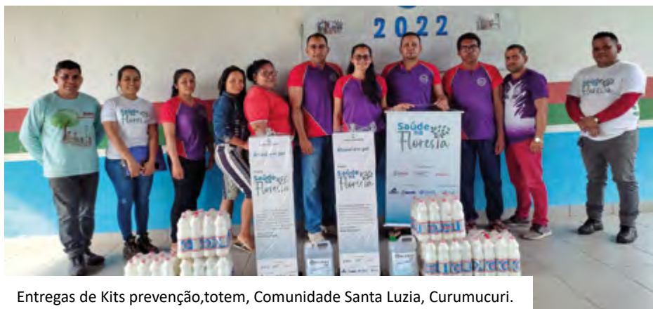
Entregas de Kits prevenção, totem, Comunidade Santa Luzia, Curumucuri.