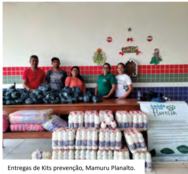
Entregas de Kits prevenção, Mamuru Planalto.

5 máscaras; 1 unidade de álcool gel de 500g.