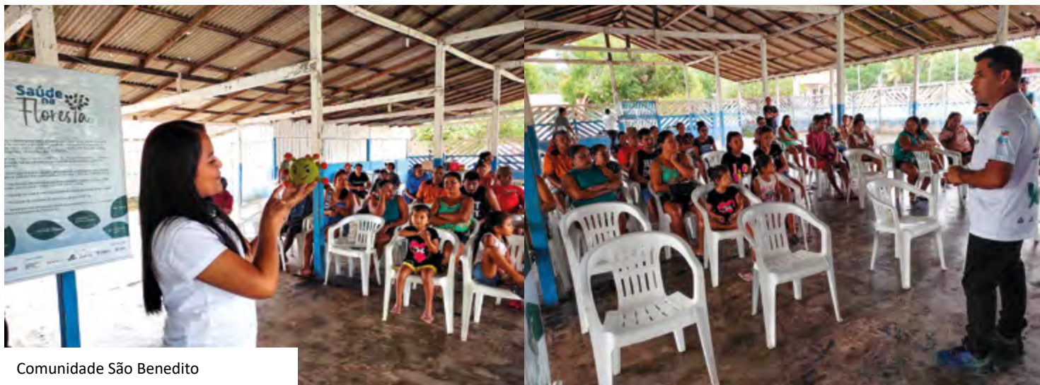
Comunidade São Benedito

Parceria com profissionais de saúde da Secretaria Municipal de Saúde e Secretaria Municipal de Assistência Social e Educação.