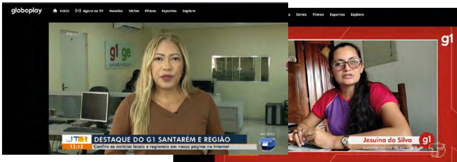
Destaques do g1 Santarém e região - Jornal Tapajós 1ª Edição

Assessoria de Imprensa – Principalmente as “campanhas Saúde na Floresta” foram retratadas em matérias para imprensa e site institucional do IJUS. As matérias foram replicadas em portais digitais, rádios e telejornais.