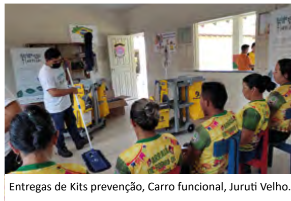
Entregas de Kits prevenção, Carro funcional, Juruti Velho.