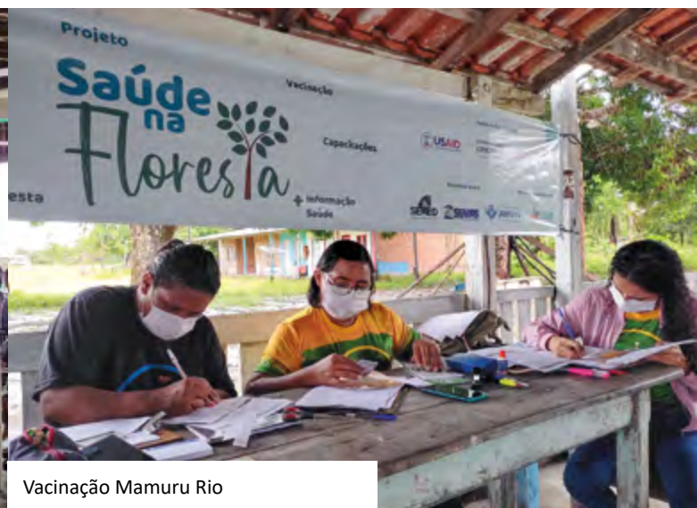
Vacinação Mamuru Rio