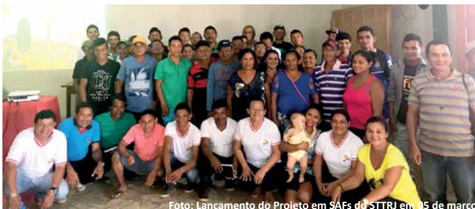
Foto: Lançamento do Projeto em SAFs do STTRJ em 05 de março

Novos horizontes se abrem com o desenvolvimento de dois projetos de Sistemas de Agroflorestais (SAF's) apoiados pelo Instituto Juruti Sustentável (IJUS) no município. Os projetos receberam investimento do Edital de Conservação e Uso Sustentável da Biodiversidade de 2017 do IJUS